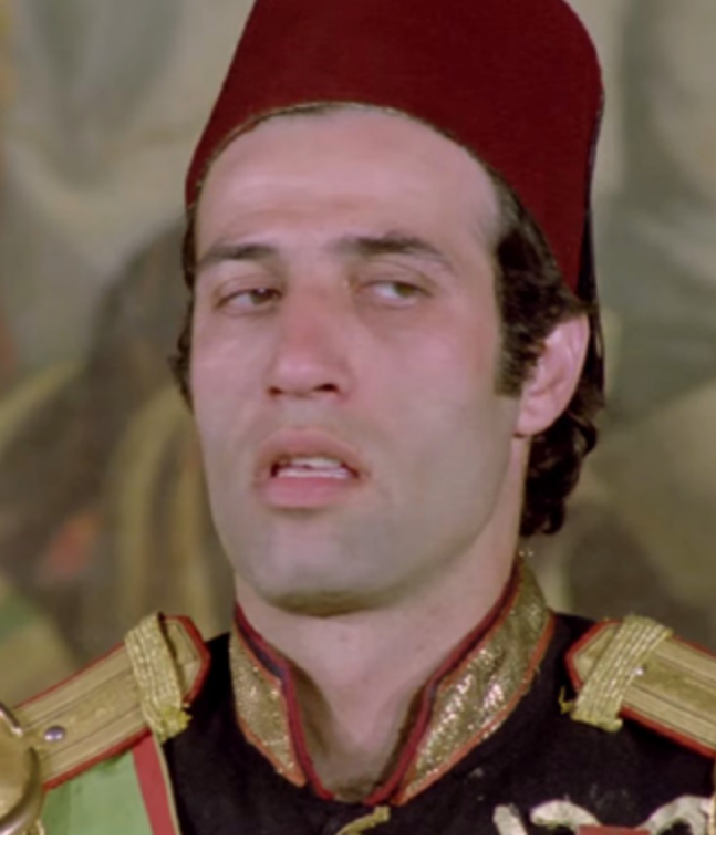
Tosun Paşa: İktidarsız iktidar