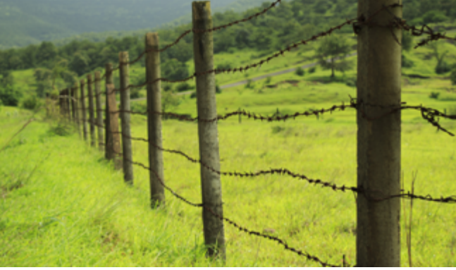
Kim kime eşittir, ne neye denk