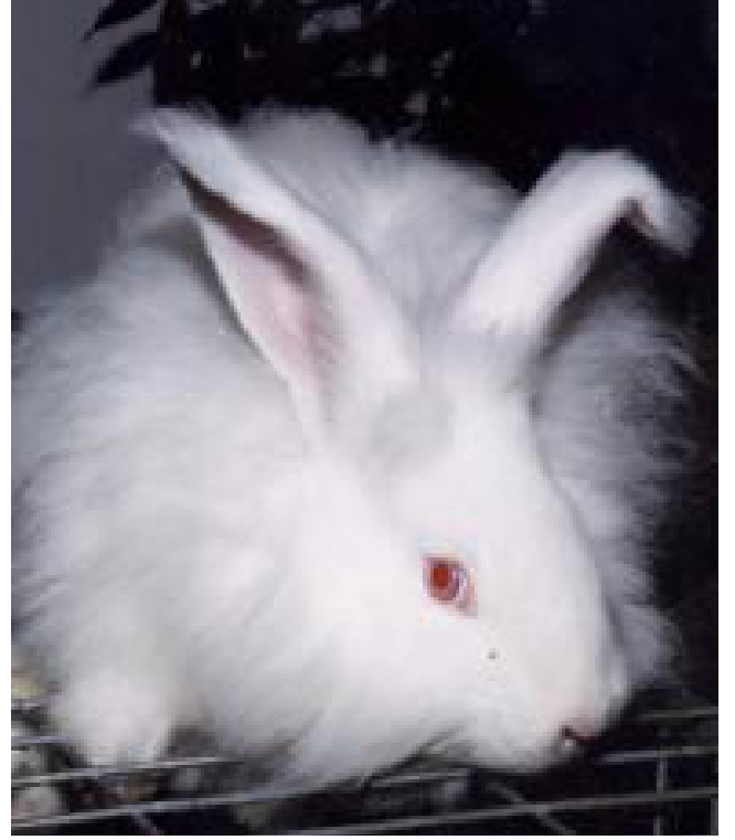
Sandıktan tavşan çıkmadı