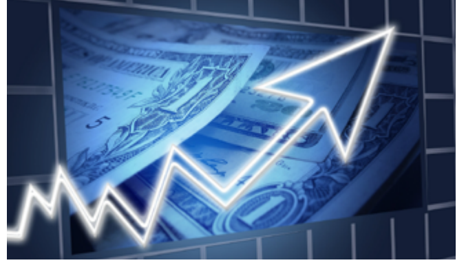
AKP, kriz ve İslamcılığın tükenişi